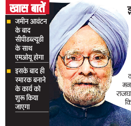
स्मारक के लिए अधिकारियों ने किया दौरा

भारत सरकार ने पूर्व प्रधानमंत्री मनमोहन सिंह के स्मारक को लेकर उनके परिवार को कुछ विकल्प दिए हैं। इन विकल्पों में राष्ट्रीय स्मृति स्थल समेत कुछ अन्य स्थानों का नाम शामिल है, जहां उनका स्मारक बनाए जाने की संभावना है। सरकारी सूत्रों के अनुसार परिवार की ओर से स्मारक की जगह चुनने के बाद ट्रस्ट बनाने की प्रक्रिया को पूरा किया जाएगा। यह ट्रस्ट स्मारक निर्माण की योजना और उसके बाद की सभी गतिविधियों की देखरेख करेगा। परिवार की तरफ से अभी तक किसी खास जगह को लेकर फैसला नहीं लिया गया है। स्मारक की जमीन के लिए ट्रस्ट आवेदन करेगा। जमीन आवंटन के बाद सीपीडब्ल्यूडी के साथ एमओयू पर दस्तखत होगा। इसके बाद ही स्मारक बनाने का काम शुरू हो सकेगा। केंद्र सरकार ने परिवार से कहा है कि वे दिए गए विकल्पों में से कोई एक स्थान का चयन कर लें। ताकि स्मारक का काम शुरू हो सके। नई नीति के अनुसार जमीन केवल ट्रस्ट को ही आवंटित की जा सकती है। ट्रस्ट के बाद ही स्मारक के निर्माण शुरू होगा।