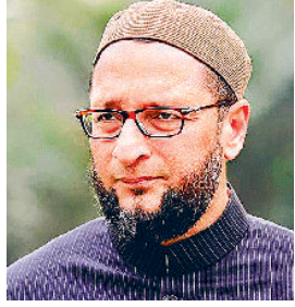
मुंबई हलचल / नई दिल्ली

देश में पूजा स्थल कानून सख्ती से लागू किया जाए, सुनवाई आज